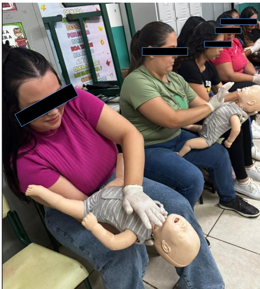
Treinamento de primeiros socorros.