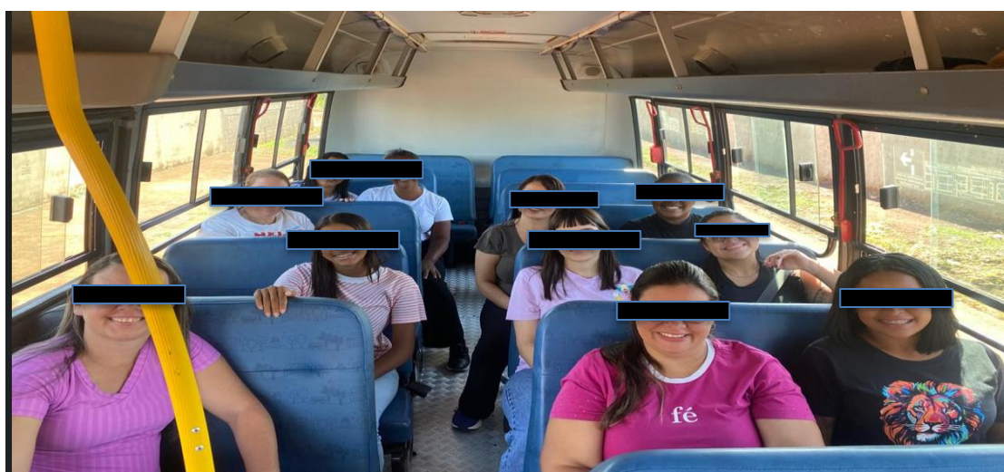
Treinamento Monitores de ônibus.