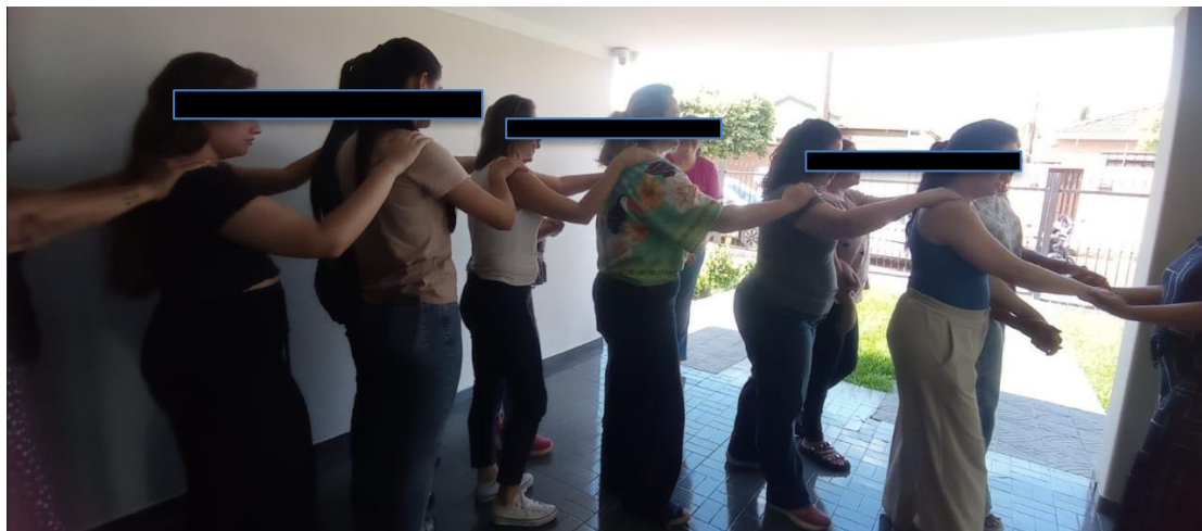
Dinâmica colocando-se no lugar do outro - simulação deficiência visual.

Dinâmica colocando-se no lugar do outro - simulação escrita com mão não dominante.