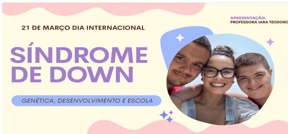
Formação: Síndrome de Down.

Abaixo, algumas fotos das formações realizadas: