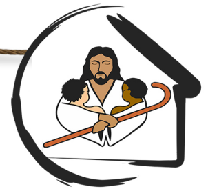
Abrigo Provisório São Giuseppe Moscati Pastoral do Menor Família da Diocese de Franca